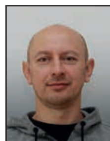
Igor Rajek Haustechnik