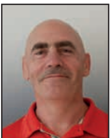
Nikolai Brill Haustechnik