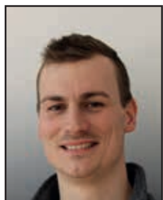
Moritz Heinrich Metalltechnik